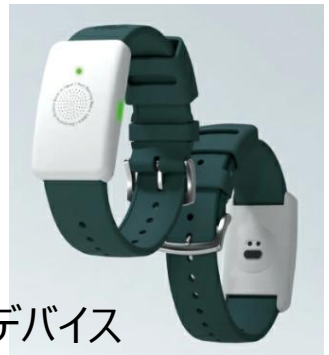
ウェアラブルデバイス

※スケジュールは計画ですので、実際の研修と異なる場合があります。予めご了承ください。